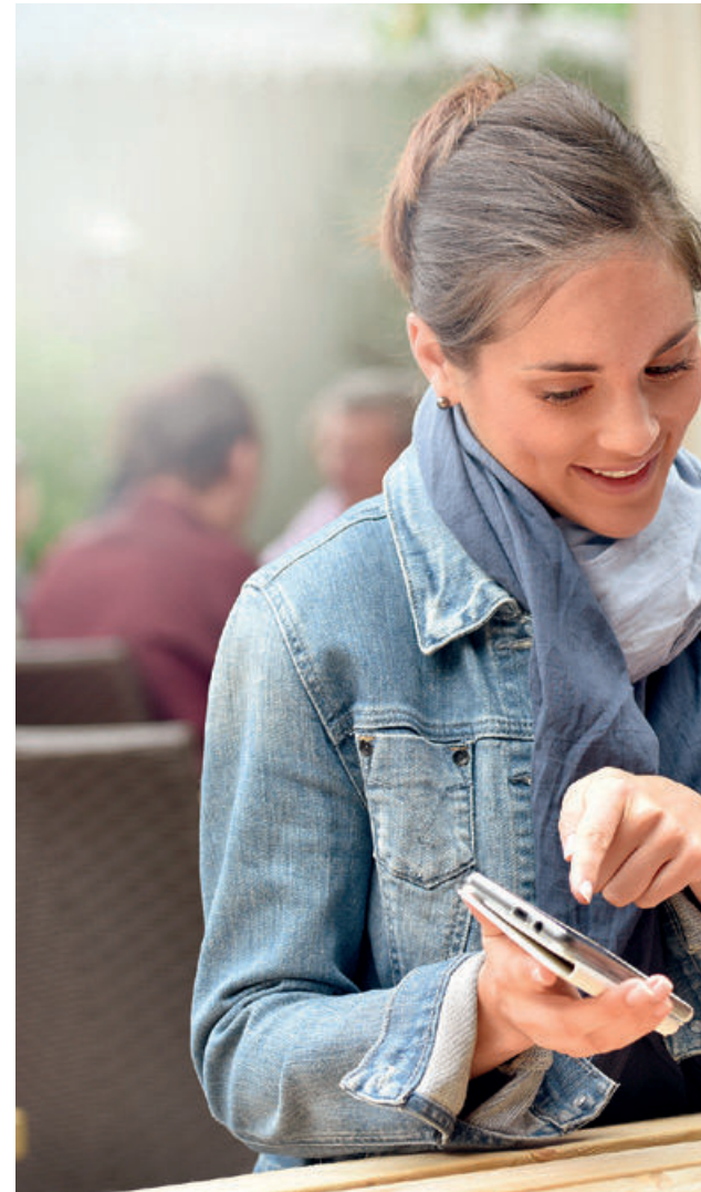
Win-win-Situation: Durch die eigene Lebenserfahrung a

Ostern ist das kirchliche Fest der Auferstehung und symbolisiert Neubeginn und Wandel. Wir stellen zwei soziale Projekte vor, in denen die Kirchgemeinde Zürich Menschen in Veränderungsprozessen oder aussergewöhnlichen Lebensabschnitten begleitet.