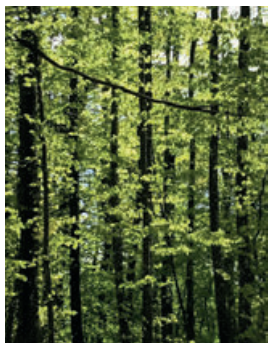
Kreuz im Wald.