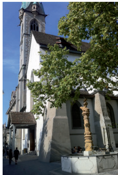
Froschauerbrunnen bei der Predigerkirche.

In diesem Sinn freue ich mich sehr, zu Ostern neu zu entdecken, dass die Dornen Rosen tragen. Mögen sie zum Erkennungszeichen dafür werden, dass der Baum des Lebens blüht.