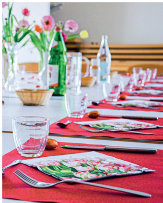
Festlich gedeckt.

Ihr Pfarrteam und Ihr Diakonieteam vom Kirchenkreis sechs