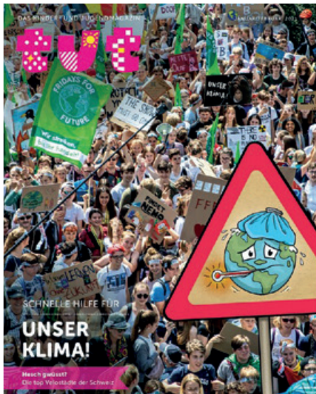
Titelbild der neusten Ausgabe.

«tut» vermittelt Wissen und Werte an 8- bis 14-jährige Kids und Teenager. Das Magazin leistet einen wichtigen Beitrag zur interkulturellen und interreligiösen Verständigung, Ökologie, fremde Kulturen und soziale Gerechtigkeit. Die redaktionellen Inhalte sind auf das definierte Altersniveau der Zielgruppe abgestimmt