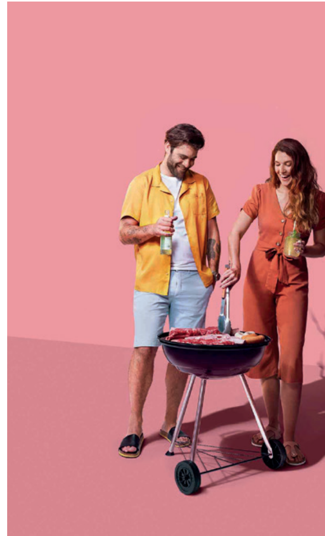
Weniger Fleischkonsum, mehr Regenwald.