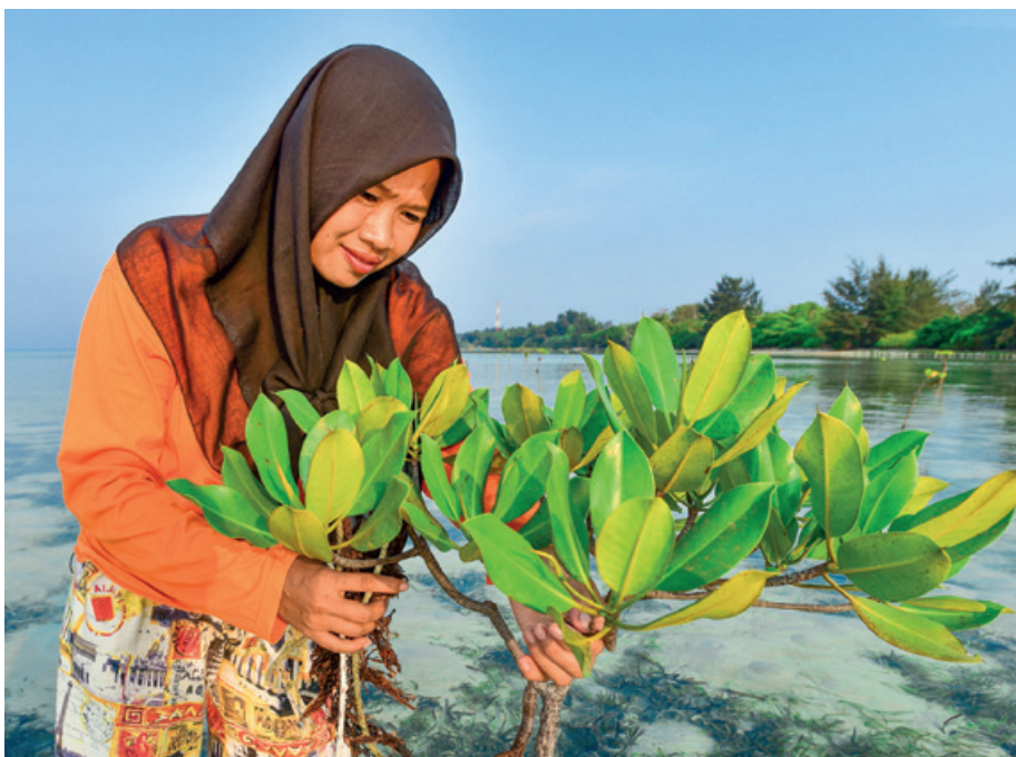
Frau aus Indonesien beim Pflanzen von Mangrovenbäumen.

Stiftung Brot für alle IBAN: CH83 0077 0016 0534 5987 8 Swift: BKBBCHBB Vermerk: 835.8061 Walhi, Indonesien