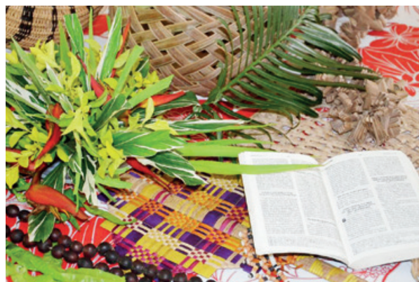
Titelbild Vanuatu.