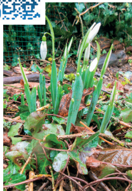
Zaghafter Frühling in Höngg.