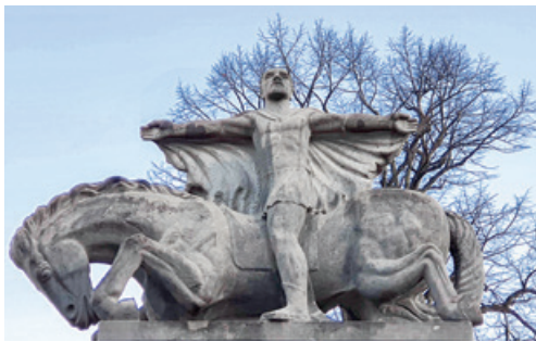
Einer der ersten Missionare: Paulus. Hier die Skulptur «Die Bekehrung des Paulus» vor unserer gleichnamigen Kirche.